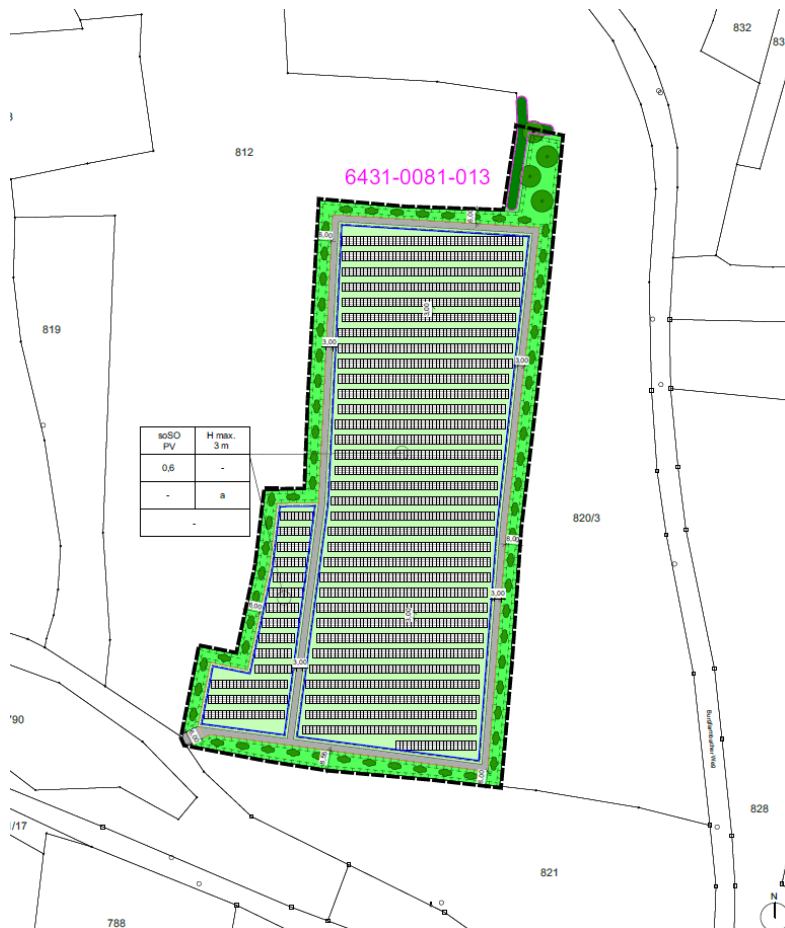
Abb. 1: Vorentwurf des Bebauungsplans Stand Februar 2025, ohne Maßstab

Rund 100 m südlich befindet sich eine bereits bestehende Freiflächenphotovoltaikanlage, in ca. 170 m Entfernung verläuft die Bahnstrecke Nürnberg – Würzburg.