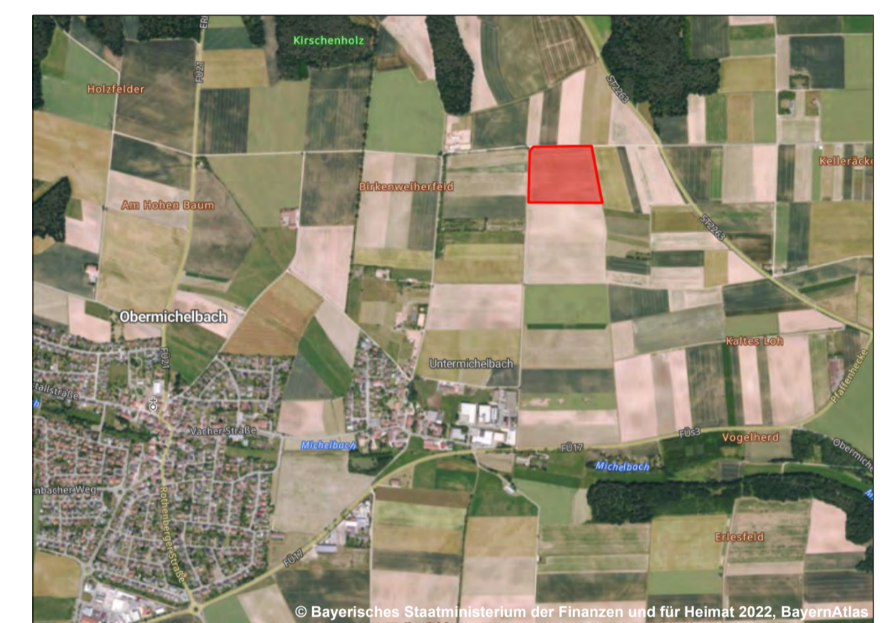
Abbildung: Zuordnung der FCS-Maßnahme – Flurstück 554, Gemarkung Obermichelbach (unmaßstäblich)