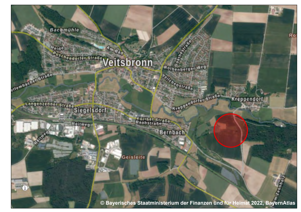
© Bayerisches Staatsministerium der Finanzen und für Heimat 2022; BayernAtlas