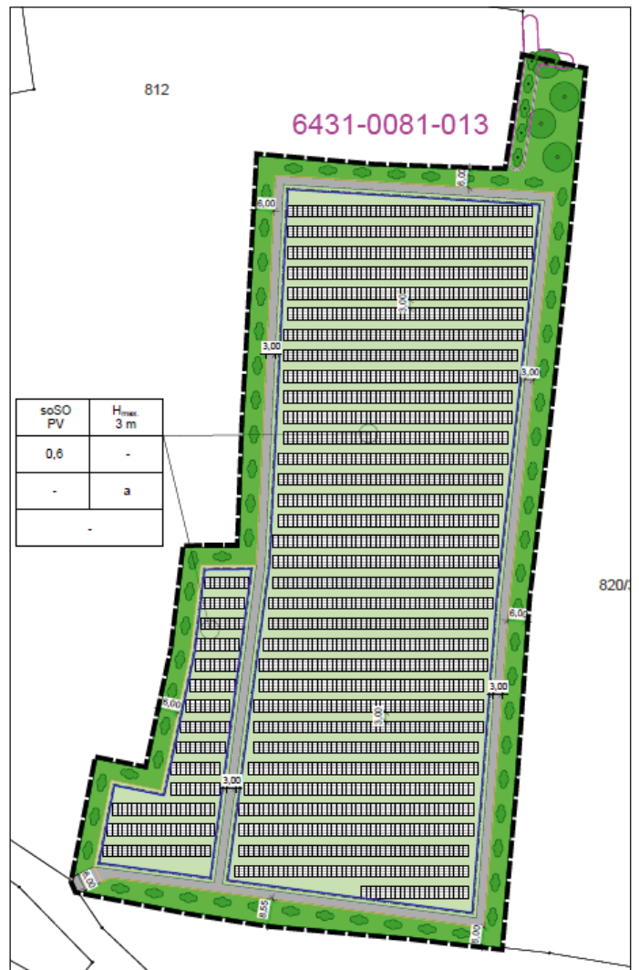
Abb. Planung Sondergebiet (Auszug aus dem Bebauungsplan – ohne Maßstab).