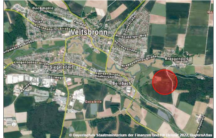
Abb. Lage des Plangebiets (Auszug aus dem Bayernatlas – ohne Maßstab).

Im o.g. Geltungsbereich soll ein Sondergebiet ausgewiesen werden. Die Lage und Abgrenzung ist aus dem nachfolgenden Kartenausschnitt ersichtlich (Siehe rote Umrandung).