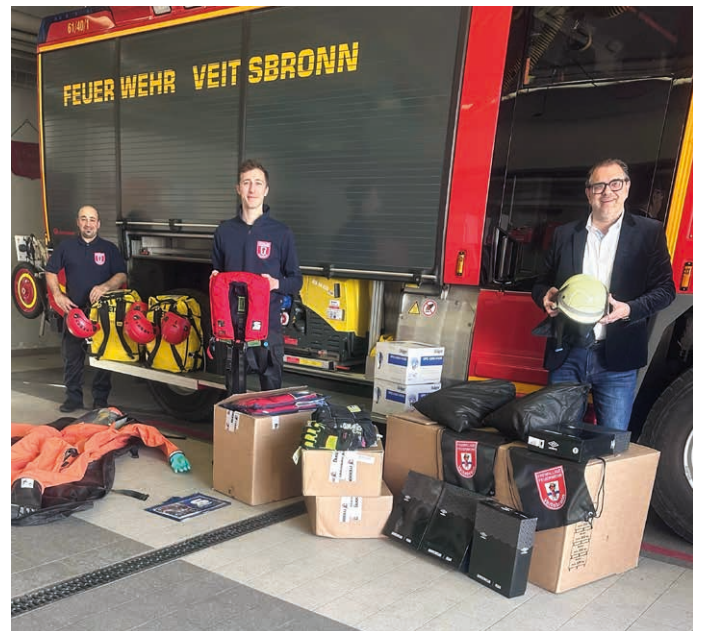
Übergabe zahlreicher Ausrüstungsgegenstände im Feuerwehrhaus Veitsbronn.

Aber auch eine regelmäßige Erneuerung der Chemieschutzanzüge, Absturzsatz, neue Helme und Handschuhe sowie Wechselkleidung ist nötig.