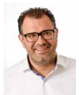
Marco Kistner 1. Bürgermeister