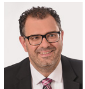
Marco Kistner 1. Bürgermeister