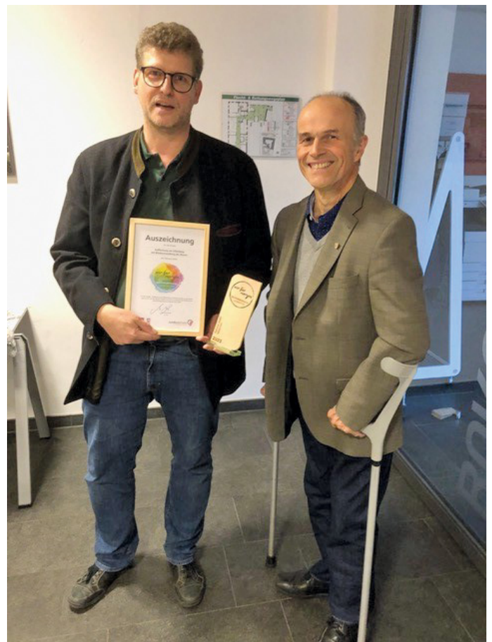
3. Bürgermeister Wolfgang Menzl gratulierte den örtlichen Preisträgern im Namen der Gemeinde

Nachhaltiges Handeln und Umweltschutz sind hier schon seit langem Programm, wie auch die bereits 2015 erfolgte Auszeichnung mit dem gemeindlichen Umweltpreis belegt.