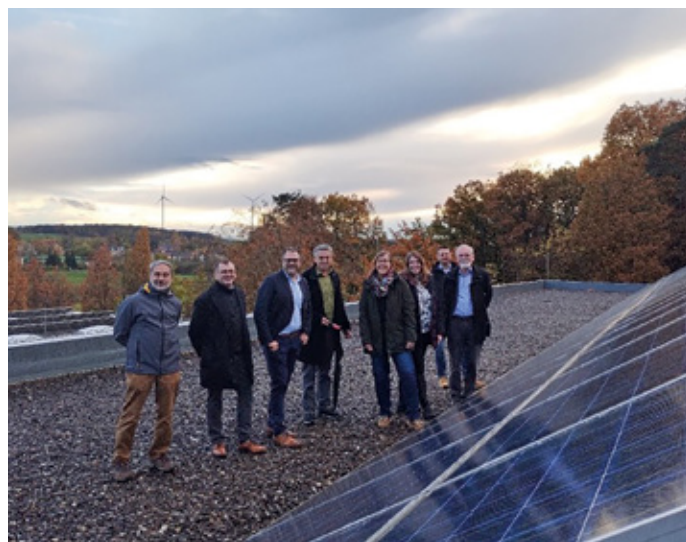
Offizielle Übergabe der PV-Anlage an die Bürgermeister der Schulverbandsgemeinden

Die Anlage hat eine Nennleistung von 66 kWp und besteht aus 330 Modulen. Die offizielle Übergabe erfolgte nun am Dach der Grundschule.