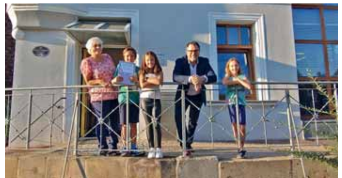
Die Gewinner der Hauptpreise mit Bürgermeister und Büchereileitung

Traditionell wurde die Abschlussveranstaltung mit Verlosung durch ein Pizzaessen begleitet.