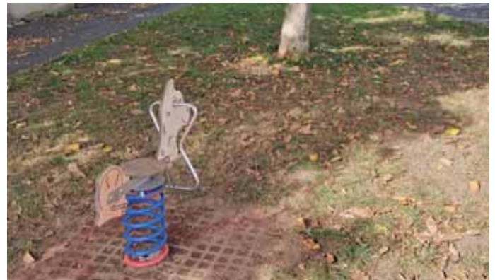
Die Umsetzung wurde durch das Team des Bauhofs realisiert.

Hintergrund der Standortwahl ist, dass es dem BabyTreff seit jeher ein Anliegen war, Spielmöglichkeiten auch außerhalb von größeren Spielplätzen zu fördern.