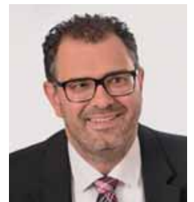
Marco Kistner 1. Bürgermeister