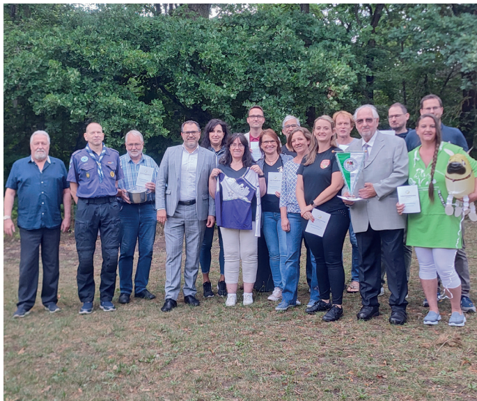
Vertreter der bedachten Vereine und Mitglieder des Stiftungsrates

Aktuell sind dies beispielsweise der Bau der Faustballhütte des ASV, die Anschaffung einer Stabhochsprungmatte, die Anschaffung eines Transporters durch den Tierschutzverein oder das Zeltlager der Jugendfeuerwehr.