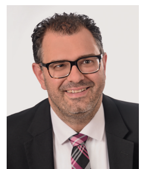
Marco Kistner 1. Bürgermeister