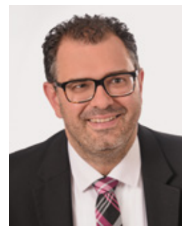
Marco Kistner 1. Bürgermeister