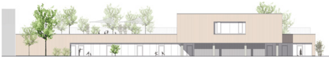
Ansichten von Süden und Osten (von der Friedrichstraße aus gesehen).

Die Firma BayernGrund als Projektsteuerer trägt dafür Sorge, dass der im Ortszentrum gelegene Neubau unter Trägerschaft der Arbeiterwohlfahrt bereits im Herbst 2024 in Betrieb gehen kann.